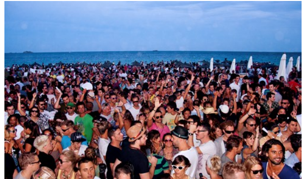
Un Mar de Gente (image cropped)

Los bares en Ibiza son tan famosos como sus discotecas, ya que establecen el estado de ánimo para la vida nocturna por venir. Las bebidas son un poco más baratas aquí que en los clubes y bares tienen entrada gratuita. Siempre hay ofertas promocionales, a veces con chupitos gratis (vacunas).