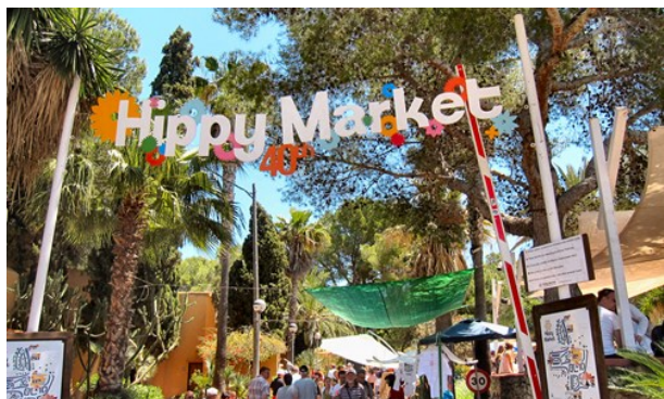
The Hippy Market . Ibiza. (image cropped)

Ibiza se jacta de tener el mayor número de tiendas en la zona más pequeña del mundo. En Ibiza se puede encontrar lo último y más loco de la moda, incluyendo accesorios para un día en la playa. Justo al sur de la ciudad de Ibiza está la estación de Figueretas. Ahí se pueden encontrar un montón de tiendas que venden las habituales marcas, ropa deportiva, souvenirs y artesanías de Ibiza. Aquí está también el gran mercado Malacoste.