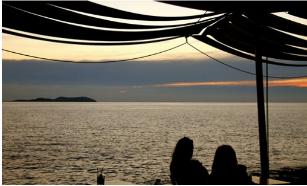
Sam Leech (image cropped)

En Ibiza puedes encontrar cafés frescos para descansar y relajarte. Elige entre un gran café, un cóctel para el almuerzo o deliciosos pasteles.