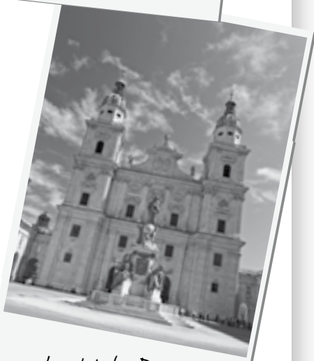
La catedral - Dom-

tienen; hacia el norte de la ciudad son sencillamente fantásticas y al sur se ven los picos alpinos, incluido el Untersberg (1853m), el pico más alto de la zona. Se tarda unos 20 minutos caminando cuesta arriba desde el casco antiguo, pero también se puede ir en el funicular, el ticket del funicular incluye la entrada a los patios de la fortaleza.