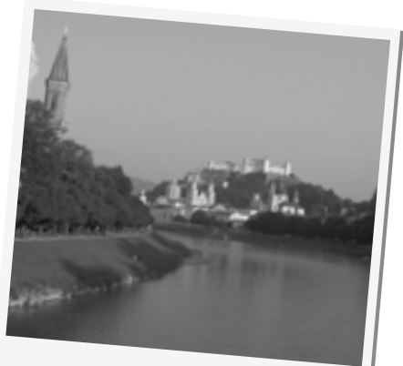
Salzburgo y Río Salzach

• Festung Hohensalzburg – fortaleza que domina la ciudad desde el monte Mönchsberg, era utilizada para vigilar la entrada de posibles invasiones y enemigos a la ciudad y fue ampliada por los arzobispos a lo largo de muchos años. En el interior se pueden visitar salas dedicadas a la tortura, una torre de vigía e impresionantes salones. También hay dos pequeños museos que abarcan historia, armas, fotografías de la II Guerra Mundial y más utensilios de tortura. Pero lo realmente bonito de subir hasta esta fortaleza son las vistas que se