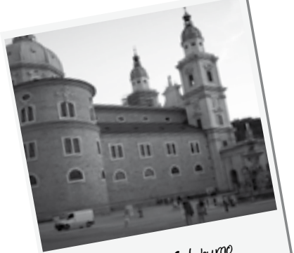
Catedral de Salzburgo