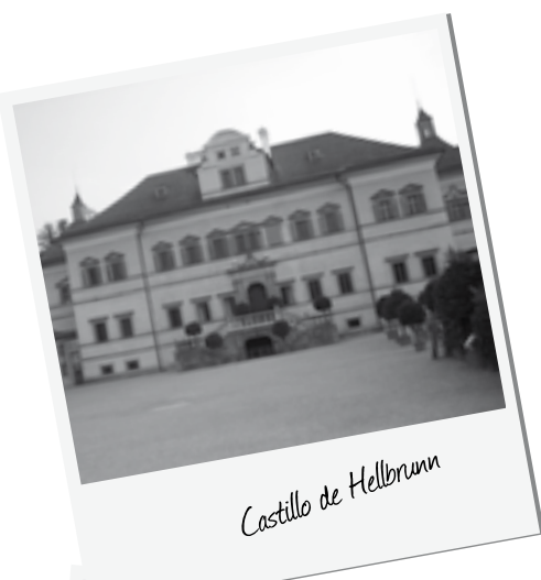
Castillo de Hellbrunn

Un atractivo pueblo, asentado en medio de un camino de tierra que bordea la orilla occidental del río Traunsee. Estos pueblos también quedan unidos por barcos que hacen bonitos paseos por el lago.