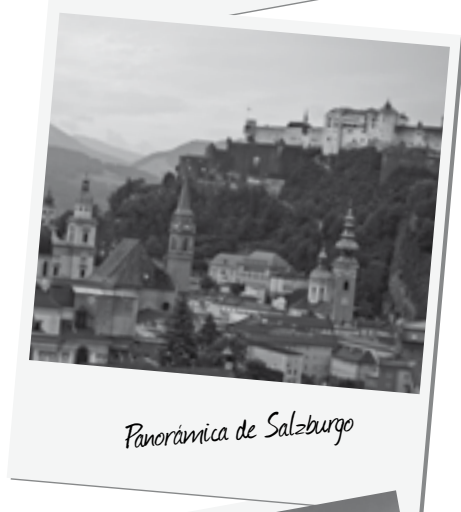
Panorámica de Salzburgo