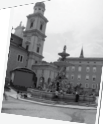
Fuente de la Residencia

En el siglo XIII se concedió a los arzobispos el título de príncipes del Sacro Imperio Romano. Su poder se extendía por una zona dos veces más grande que la de la provincia actual, y abarcaba partes de Baviera e Italia. El poder económico estaba basado en las minas; había yacimientos de oro, pero desde el tiempo de los celtas adquieren una gran importancia las minas de sal, el llamado "oro blanco".