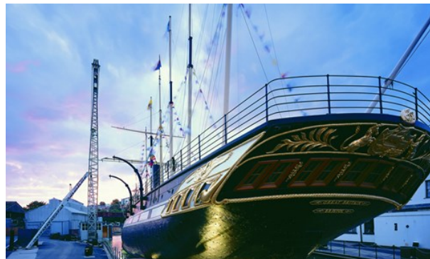
Brunel's ss Great Britain