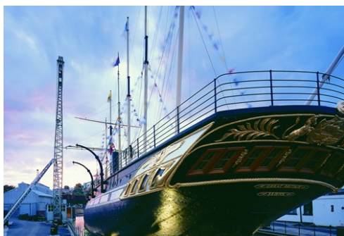
Brunel's ss Great Britain