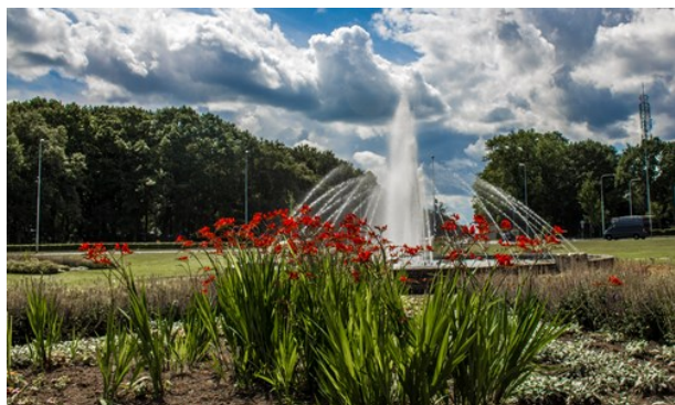
Lennart Tange (image cropped)