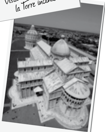
La Catedral vista desde la Torre inclinada

ahora queda distante varios kilómetros, nos siguen quedando los recuerdos de una de las principales repúblicas marítimas italianas y de su extraordinario y personalísimo arte, el Románico pisano.