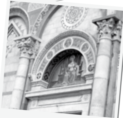
Puerta 1ª del Duomo