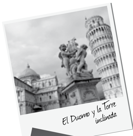
El Duomo y la Torre inclinada

Aparte del campo de los milagros Pisa dispone de algunos monumentos más como el museo de la ópera del Duomo con obras procedentes de la Catedral. O el museo de San Mateo con pinturas pisanas. O varias iglesias dispersas por la ciudad como la Iglesia de Santa María de la Spina, Santa Catarina... Y algunas bellas plazas como la del Cavallieri en el centro de la ciudad.