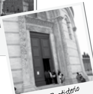
Puerta del Baptisterio