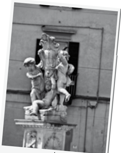
Estatua de los niños en el Campo dei Miracoli

El siglo XII y principios del XIII fueron su época de esplendor. Fue cuando se construyeron sus principales monumentos, se creó su universidad y fue una gran dominadora de los mares. Muy dura fue su lucha con Génova por mar, y con Lucca y Florencia por tierra, al apoyar la causa Gibelina, partidaria del emperador, contra los güelfos partidarios del Papa. Su final llegó tras la Batalla de Meloria, en 1284 que destruyó su flota. Arruinada y sin poder defender su imperio marítimo que fue desapareciendo, quedó definitivamente bajo la tutela de Florencia en el año de 1406. Sin embargo los Medicis la dieron una atención especial a la ciudad en el plano científico donde destacó el