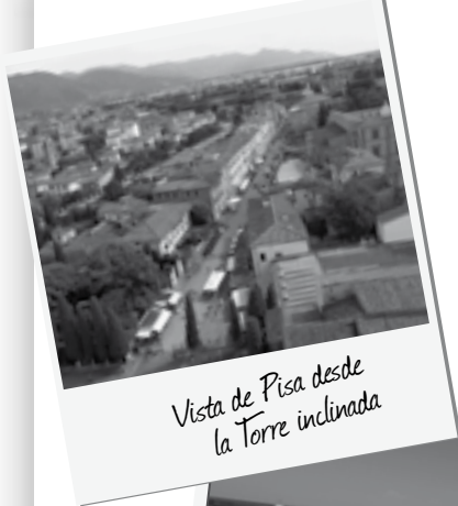
Vista de Pisa desde la Torre inclinada